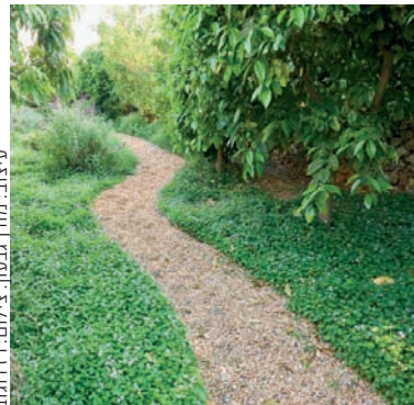
עיצוב: מורן בעזון