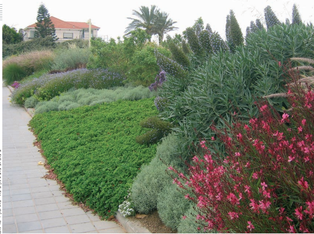
עיצוב וביצוע גינת ציבור בארסוף. טירנוס